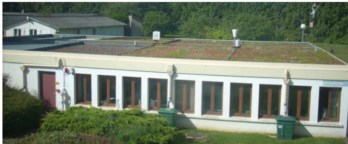
Toiture végétalisée du Centres d'Etudes Techniques de l'Équipement (CETE) Ile-de-France à Trappes.